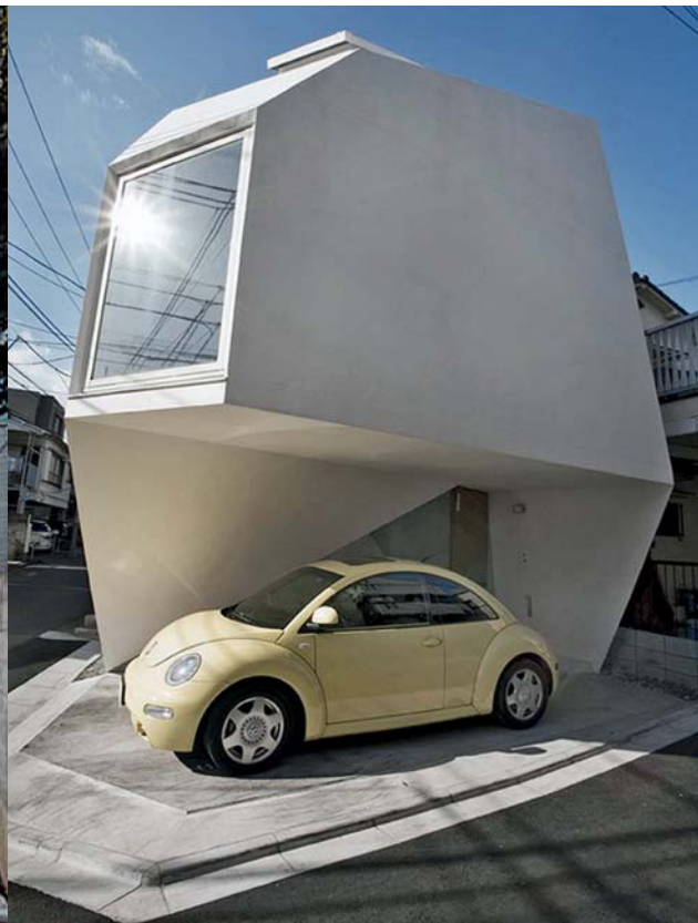
Yasuhiro Yamashita, Atelier Tekuto, Dům Reflection of the Mineral

kou dobrovolného vyhledávání minimálních úsporných prostor cítěno jako přeintelektualizovaná hříčka. Neboť bývá pravidlem, že jakmile se společnost oklepe z nejhorsího, rychle zapomíná na těžce nabytou zkušenost existenciálního základu a záhy vklouzne do dřívějších kolejí.