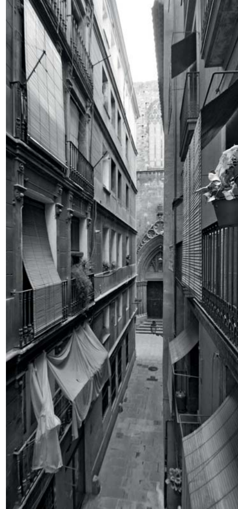
Ulice Barcelona

I když tato kategorie, do níž spadá sociální a existenční nedostatek, katastrofy přírodní